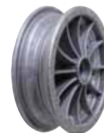
cerchio componibile 6" o 8"