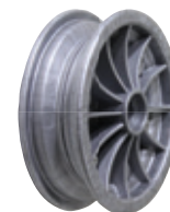
cerchio componibile 6" o 8"